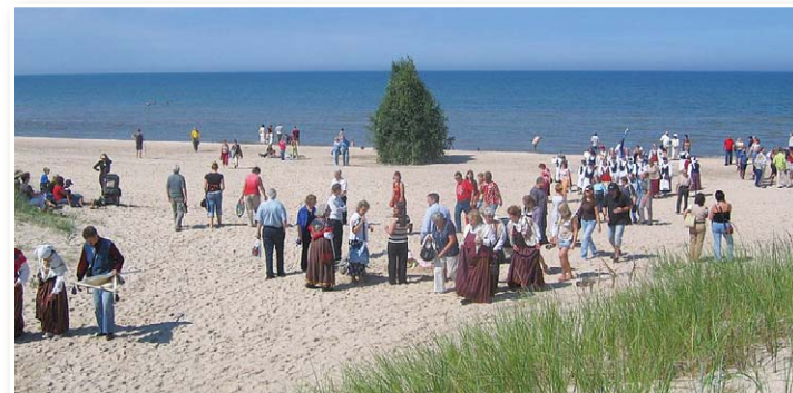
Jūras krastā pie Mazirbes