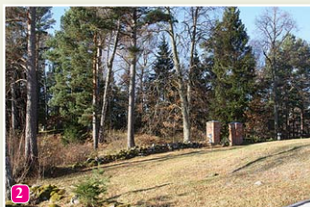
Veco kapu kalniņš