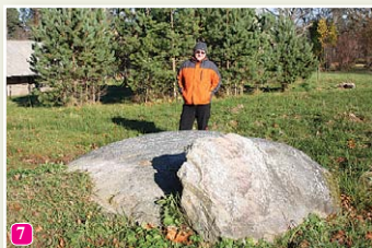
Mēra akmens pie baznīcas