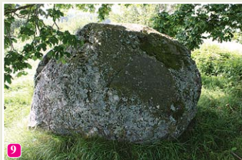
Lielais Mēra akmens