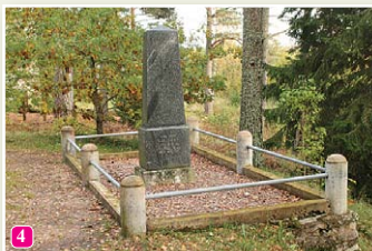
Vecā Taizeļa piemineklis