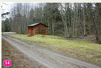
Bijušais šaursliežu dzelzceļš