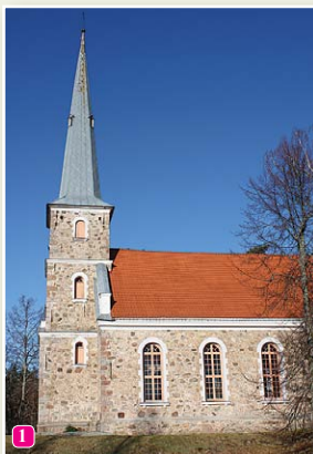
Mazirbes luterāņu baznīca

22 Bijusi kroga vieta – Ūbelēs, Mazirbes – Cirstes ceļa malā.