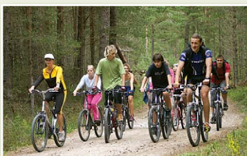
Meža ceļš starp lībiešu ciemiem