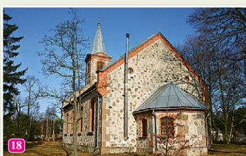
Kolkas luterāņu baznīca