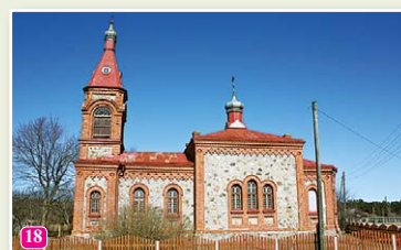
Kolkas pareizticīgo baznīca