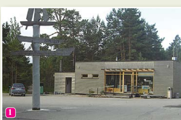
Kolkasraga apmeklētāju centrs

18 Kolkas baznīcas – luterāņu (uzcelta 1886. g.), pareizticīgo (uzcelta 1890. g., padomju laikā izmanto par kapliču, tagad – funkcionējoša baznīca) un katoļu baznīca (1997.g.).