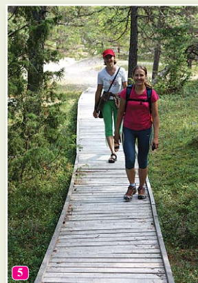
Kolkas raga priežu taka