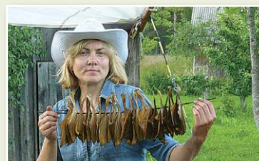
Lauku labumu saimniecības "Krāces" Kolkā