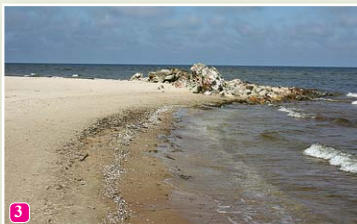
Kolkasraga vecās bākas drupas