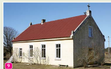
Pitraga baptistu baznīca