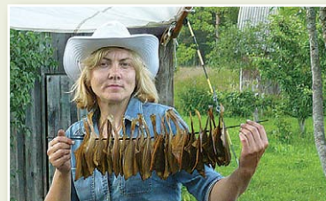
Сельские блага хозяйства «Krāces» в Колке