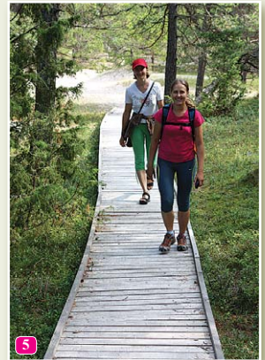
Колкасрагская тропа сосен