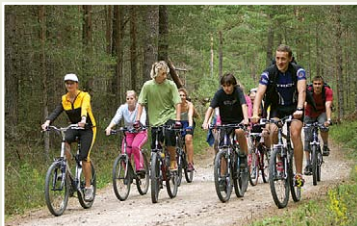
Лесная дорога через поселки ливов