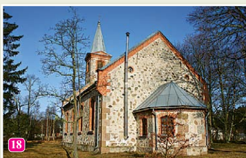
Колкская лютеранская церковь