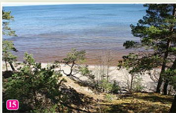
Эважский отвесный берег