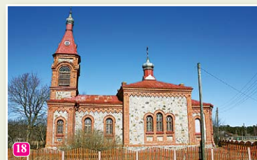
Колкская православная церковь