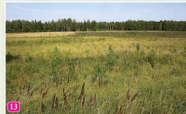
Думельские озерные луга