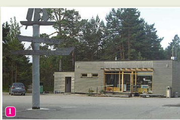
Колкасрагский центр для посетителей

18 Церкви Колки – лютеранская (построена в 1886 г.), православная (построена в 1890 г., в советское время использовали под каплицу, теперь – функционирующая церковь) и католическая церковь (1997 г.).