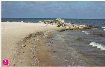
Развалины старого Колкасрагского маяка