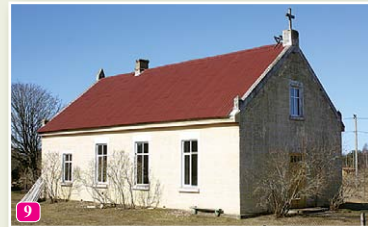
Питрагская баптистская церковь