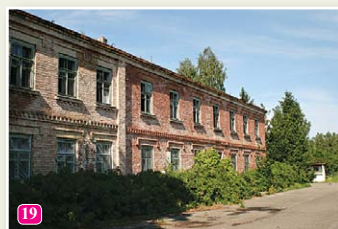
Здание бывшей Морской школы