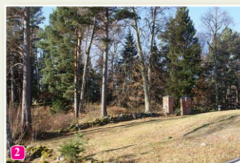
Холм древних захоронений