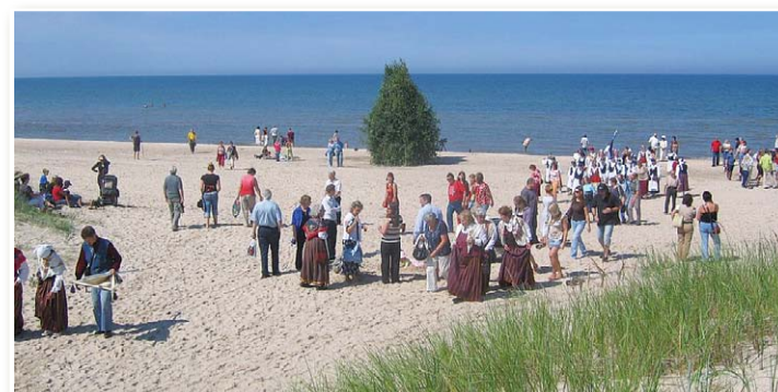
На побережье у Мазирбе