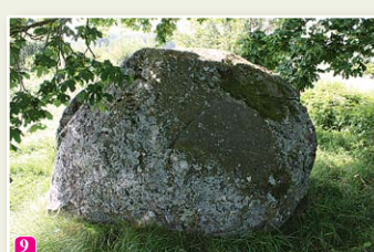
Большой чумной камень