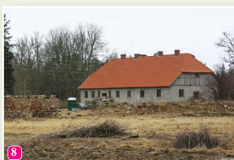
Жилое здание бывшей усадьбы пастора