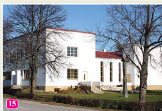
Народный дом ливов