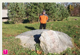
Чумной камень у церкви